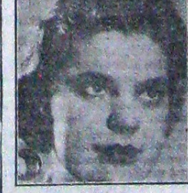
studentă în vârstă de 21 ani

decedate Duminică 10 Noiembrie 1940 în groznică prăbușire a blocului Carlton. Slujba religioasă se oficiază Joi 14 Noiembrie a. e. la Biserica Sf. Ilie Gorgani, orele 13, de unde cortegiul va porci spre Cimitirul Bănu unde va avea loc înmormântarea.