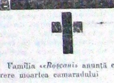
Familia «Rosconis» anunță cu durere moartea camaradului

decedată Duminică 10 Noiembrie 1940 în groznică prăbușire a blocului Carlton. Slujba religioasă se oficiază Joi 14 Noiembrie a. e. la Biserica Sf. Ilie Gorgani, orele 13, de unde cortegiul va avea loc înmormântarea.