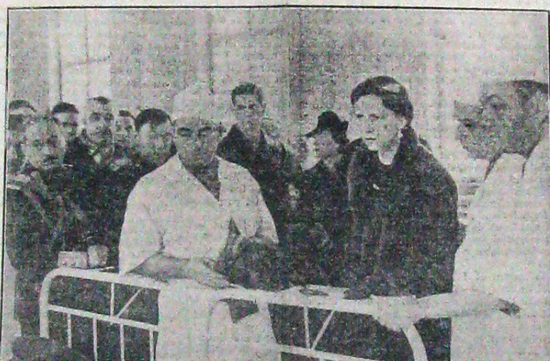
Majestatea Sa Regina Mama și Suveranul, interesandu-se la spitalul militar de starea ranitilor de pe urma cutremurului